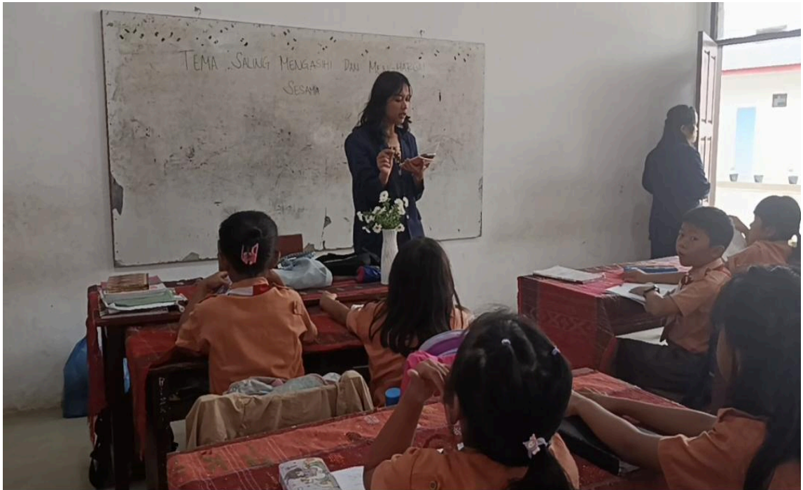
Gambar 5. Penyampaian Materi