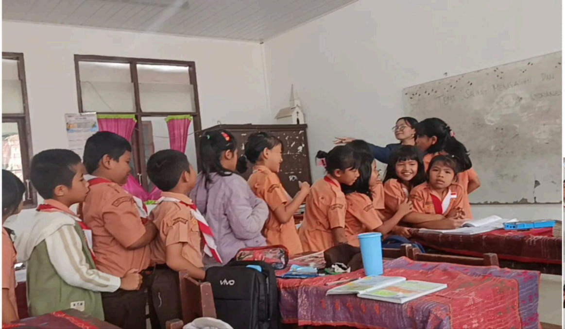
Gambar 6. Bermain Games