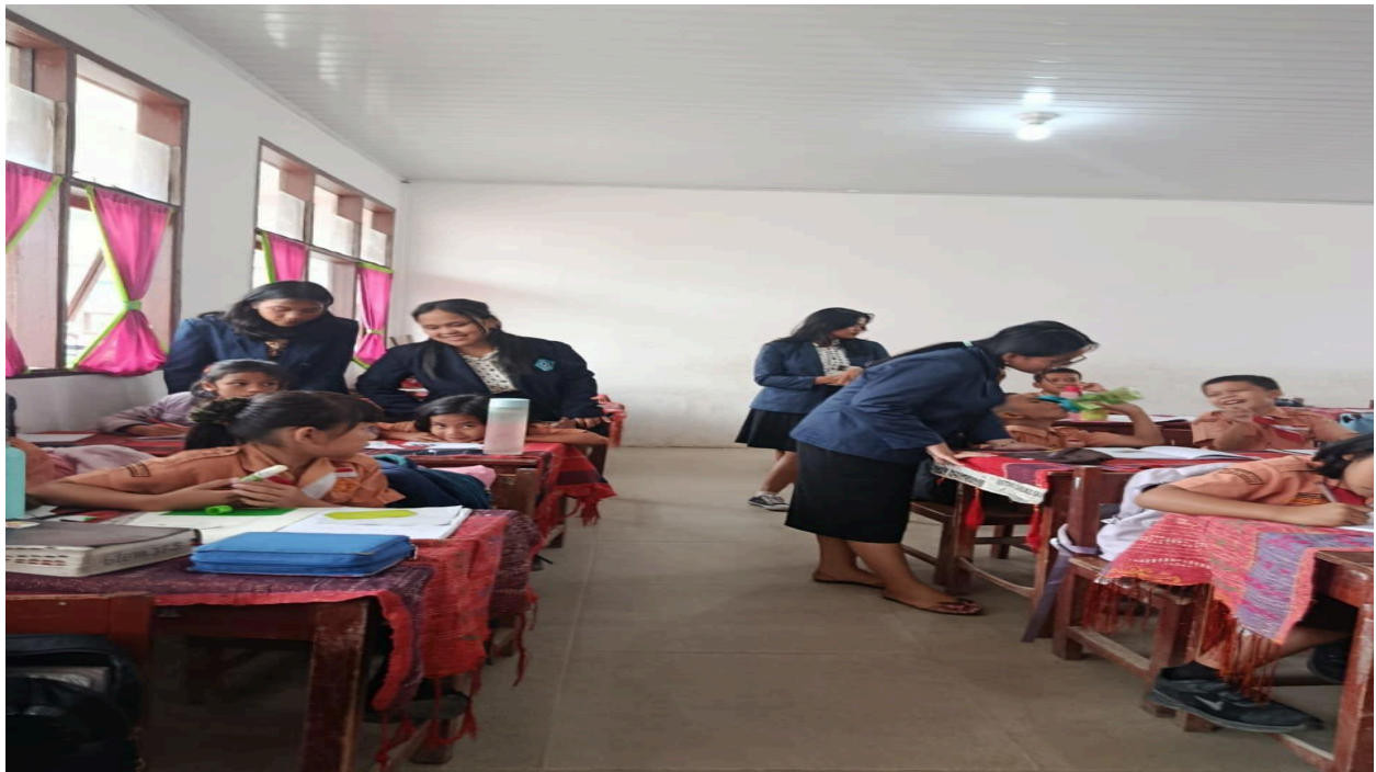
Gambar 7. Menulis Pesan dan Kesan oleh Anak SD Kelas 3