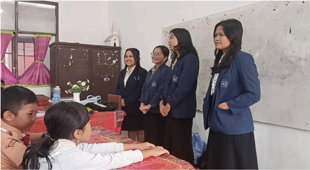
Gambar 1. Perkenalan Tim PKM kepada Anak SD Kelas 3