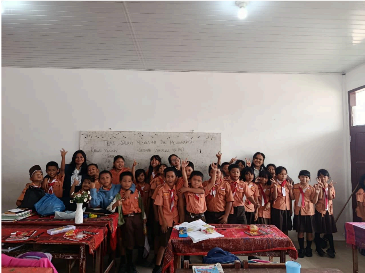
Gambar 9. Foto Bersama Anak SD Kelas 3 Lumban Baringin