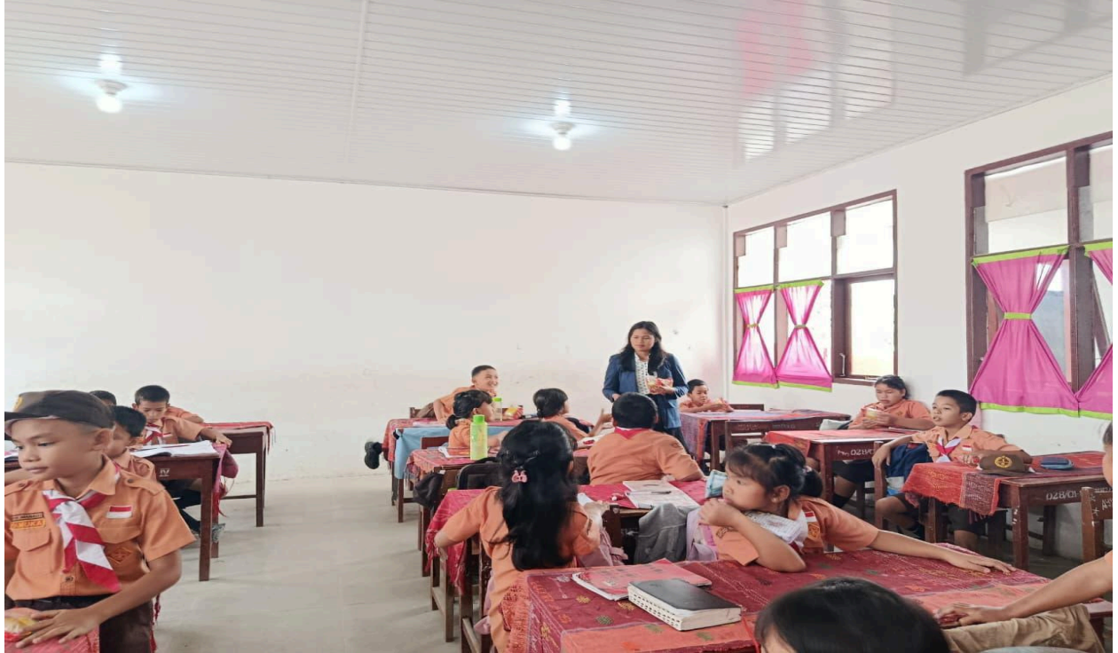
Gambar 8. Pembagian Snack